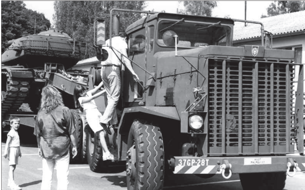
Bei dem Freundschaftsfest 1988 sind Fahrzeuge zu besichtigen und zu bestaunen: Hier eine Zugmaschine mit einem anhängenden Tieflader und einem Panzer

Lodge war vorbei. Der „Officers Club“ mit seinem Angebot war schon vorher umgezogen. Das Erdgeschoss wurde umgebaut zur Nutzung für eine Abteilung der 22 nd Signal Brigade. Drei weitere Abteilungen wurden in den Häusern 1041 (Verwaltungsgebäude), 995 (Hessenland) und 990 (Maintal) untergebracht. Haus Rheingau (1028) gegenüber der Mountain-Lodge war zeitweise Gästehaus des Ambassador Arms Hotel in Frankfurt.