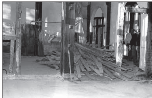
Mit erheblichem Kostenaufwand wurde die Mountain-Lodge 1988/89 umgebaut, um für Büros und Computer-Arbeitsräume genutzt zu werden

Im Dezember 1989 wurde im Zuge der politischen Umorientierung die 4 th Transcom nach Kaiserslautern verlegt und einer anderen Einheit angegliedert. Bei dieser Gelegenheit sagte der neue Commander, Generalleutnant William S. Flynn: „If you're wearing it, driving it, reading it or eating it, you get it from the Fourth“, d.h. „Was immer du am Leib trägst, womit du fährst, was immer du liest oder auch ißt, du hast es von der Vierten. Es gibt keine Einheit, die mehr Einfluß auf die amerikanischen Soldaten in Europa hatte, als die Vierte!“ (d.i. 4 th Transcom).