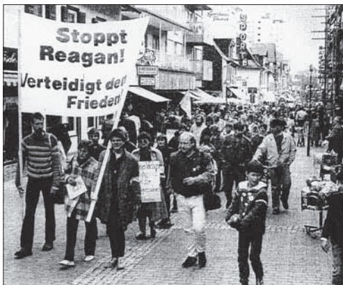
Oberurseler Bürger am 21.4.1986 auf einem Friedensmarsch vom Kriegerdenkmal in der Allee durch die Vorstadt zum Eingang von Camp King.

wegung und der Friedensinitiativen. Im April 1983 zog eine Gruppe aus Fulda, Marburg und Gießen zur Abschlusskundgebung des Ostermarsches auf dem Paulsplatz in Frankfurt auch über Oberursel und das Camp King. Örtliche und regionale Friedensinitiativen schlossen sich am Tor zum Lager dem Protest an. Klar war die Ansage, dass sich die Demonstration nicht gegen die amerikanische Bevölkerung richtet. „Wir demonstrieren gegen diese Einrichtung, weil sie unser Leben nicht sicherer macht, sondern eine permanente Bedrohung darstellt.“ Dann bildeten die etwa 2.500 Teilnehmenden eine Menschenkette um den Zaun. Lieder von Bob Dylan begleiteten die Aktion, auch „Blowing in the Wind“ und besonders „We shall overcome“. Im folgenden Jahr „verminten“ Demonstranten die Einfahrt zum Lager mit Schnur und Blechbüchsen. Auf Transparenten war zu lesen: „Gegen den Aufrüstungswahnsinn in Ost und West“, „Frieden – Es gibt keine andere Wahl!“, „Abrüstung mit Sicherheit – JA!“ Später gab es auch Demonstrationsgänge der Oberurseler Friedensinitiative (bis 1987), beginnend am Kriegerdenkmal in der Adenauer Allee, durch die Vorstadt und die Hohemarkstraße zum Camp King.