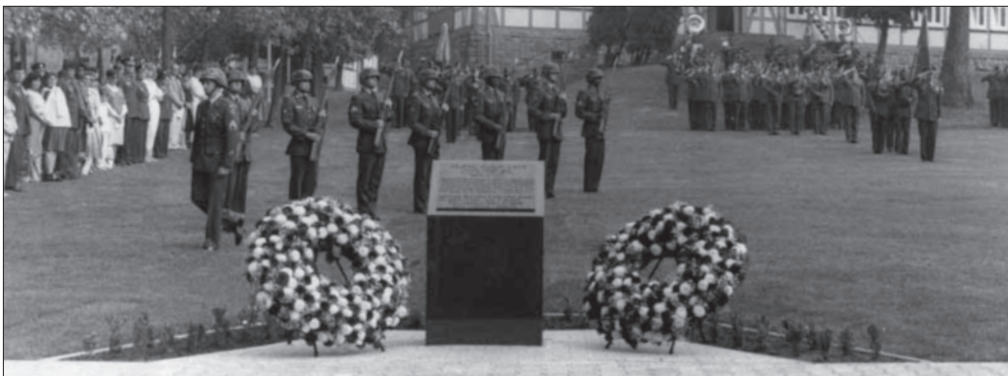
Bei der Parade zu Ehren Col. King sind am 13. August 1986 vor dem Gedenkstein Vertreter aller nachgeordneten Einheiten angetreten

Die Zahl der Mitarbeitenden auf dem Camp-King-Gelände lag zwischen 300 und 550 Personen, wobei der Anteil der lang-