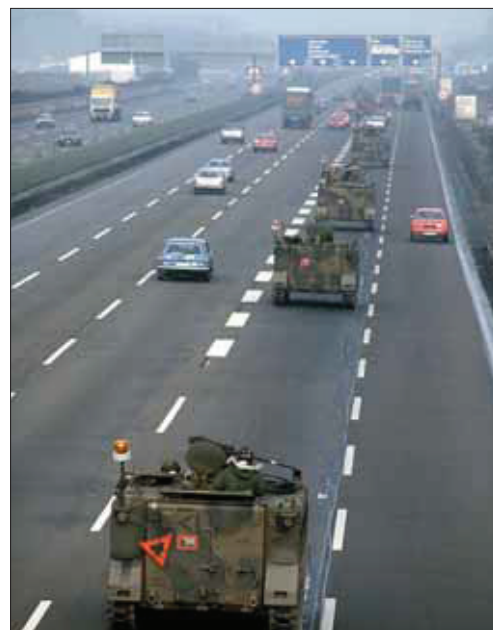
Eine Kolonne M113 Panzerfahrzeuge auf der BAB vor dem Frankfurter Kreuz, REFORGER 1985

schen 16.000 und 22.000 Soldaten, die mit Transportflugzeugen wie C-130 „Hercules“ oder C-5 „Galaxy“ in Stunden von den USA zu Flugplätzen wie Rhein-Main-Air-Base oder Ramstein bei Kaiserslautern geflogen wurden. 1979, bei einem Wintermanöver, waren 134 Flüge erforderlich. Per Schiff wurden 1.555 Radfahrzeuge, 580 Panzer und 500 Container mit Ausrüstung herangeschafft und in Antwerpen und Amsterdam ausgeladen. Das Hauptkontingent an Material, Fahrzeugen, Waffen und Ausstattung war langfristig in Depots auf dem Gebiet der BRD eingelagert. Deshalb mussten die ankommenden Soldaten nach der Einweisung und dem Einsatzbefehl sofort vom Flughafen zum Depot gebracht werden, dort die Ausrüstung überprüfen, die Vorräte in Empfang nehmen, die Fahrzeuge in Bewegung setzen und in die Bereitstellungsräume des Manövergebietes fahren, alles genau nach Plan!