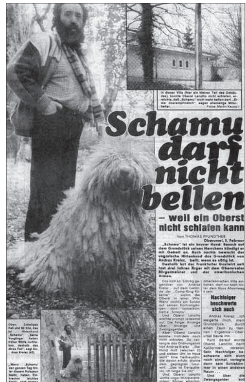
Der bellende Hirtenhund kommt am 03.02.1983 auf die Titelseite der BILD-Zeitung

Eine andere Dimension hatten die Demonstrationen im Zuge der Ostermarschbe-